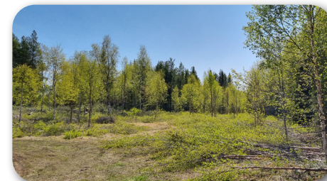
Här öppnas ängarna upp

Fredrik Wilén är initiativtagare till detta projekt och oj så fint det blir!