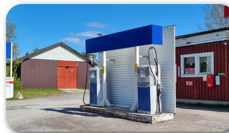
Pumpön med nytt brandskydd

Miljötilståndet för macken är klart och Skoogs bränsle har påbörjat byggnationerna kring pumpön. Förhoppningen är att allt ska vara klart och i drift i mitten av juni.