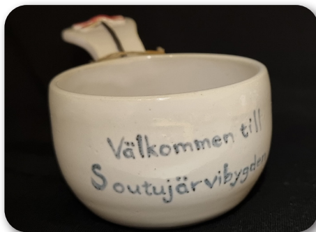
Gåva till nyfödda i bygden, en minikåsa tillverkad av Killinge Keramik.