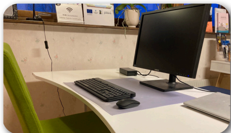
Digitala noden i Skaulo

Den digitala noden är en kontorsplats med WiFi som kan bokas kostnadsfritt på Servicekontoret i Skaulo. Här kan du tex sitta och jobba, delta på ett digitalt möte, betala räkningar eller surfa på internet.