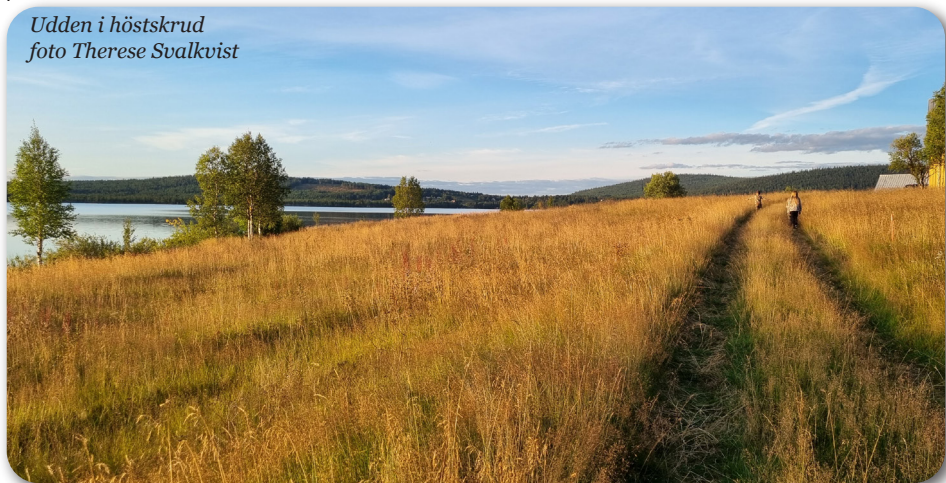
Udden i höstskrud

Ett nyhetsmagasin för alla som vistas, lever och trivs i Soutujärvibygden