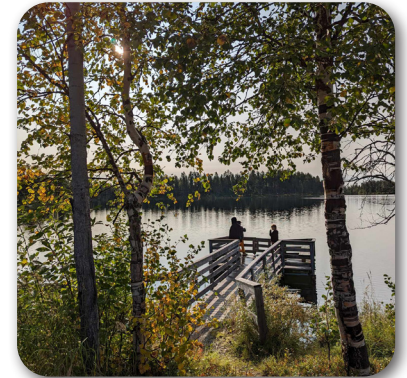
Fiske i Marsijärvi

så var det fantastiskt att se när glöden i ögonen tändes när draget flög ut, och hur en del knappt kunde komma till elden en stund för att fika.