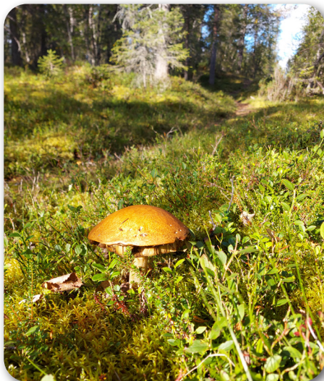
En solande svamp vid Isovaara